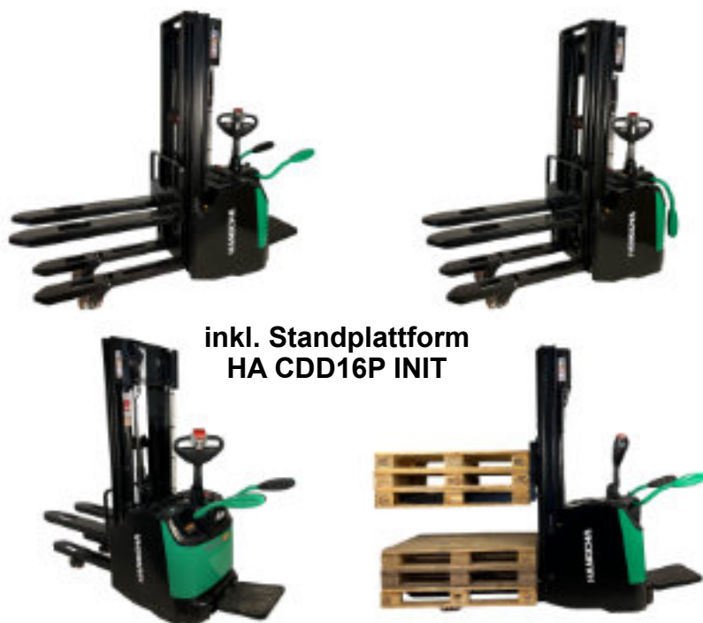
inkl. Standplattform HA CDD16P INIT

Alle Angebote richten sich an Industrie, Handel, Gewerbe und Handwerk. Preise verstehen sich ex Werk, exkl. MwSt. Werksgarantie 12 Monate. Druckfehler, Irrtümer und Änderungen sind vorbehalten.