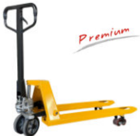
PAL BFQ 115 GU (Industrie-Rolli mit Quicklift = Schnellhub)