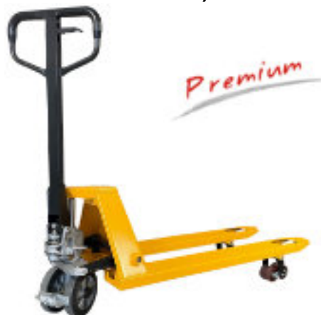
PAL BFQB 115 GU - optimal für Transport (Industrie-Rolli mit Quicklift = Schnellhub & Excenter Feststellbremse)