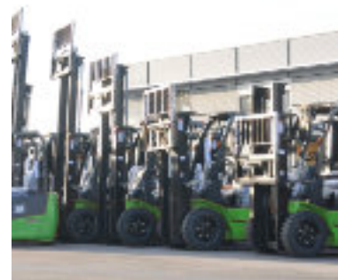
Ab Lager lieferbar