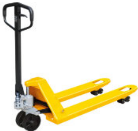
PAL BFQ 115 PU (Industrie-Rolli mit Quicklift = Schnellhub)