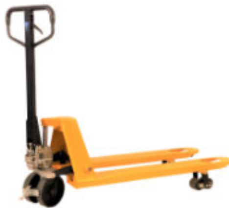
PAL BFQB 115 PU - optimal für Transport (Industrie-Rolli mit Quicklift = Schnellhub & Excenter Feststellbremse)