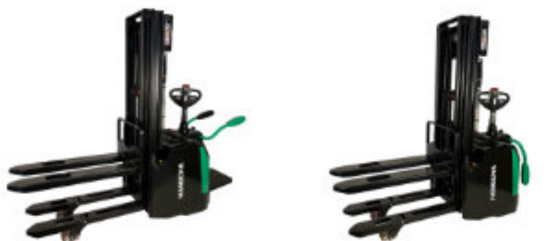
inkl. Standplattform HA CDD16P INIT